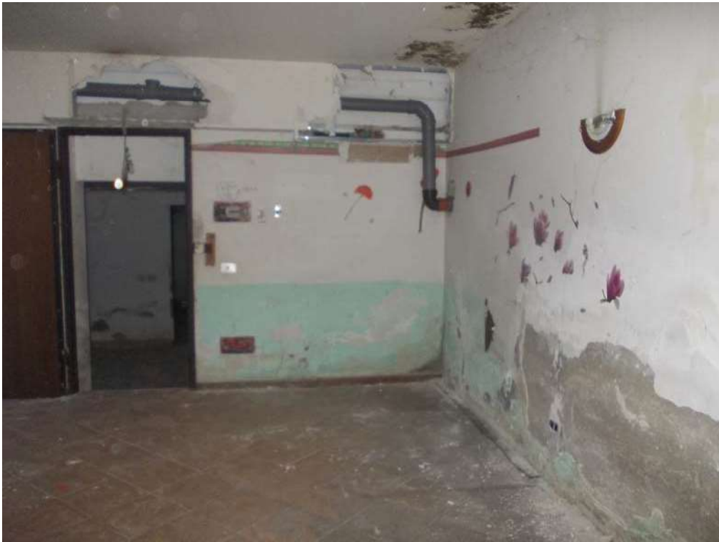
Porta di accesso: vista dall'interno

Immobile ubicato in Comune di Milano via San Gerolamo Emiliani n. 2 Esecuzione Immobiliare N. 15-2020 – Tribunale di Milano