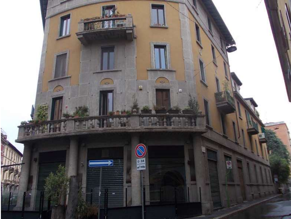
Vista esterna da strada della Carità

Immobile ubicato in Comune di Milano via San Gerolamo Emiliani n. 2 Esecuzione Immobiliare N. 15-2020 – Tribunale di Milano