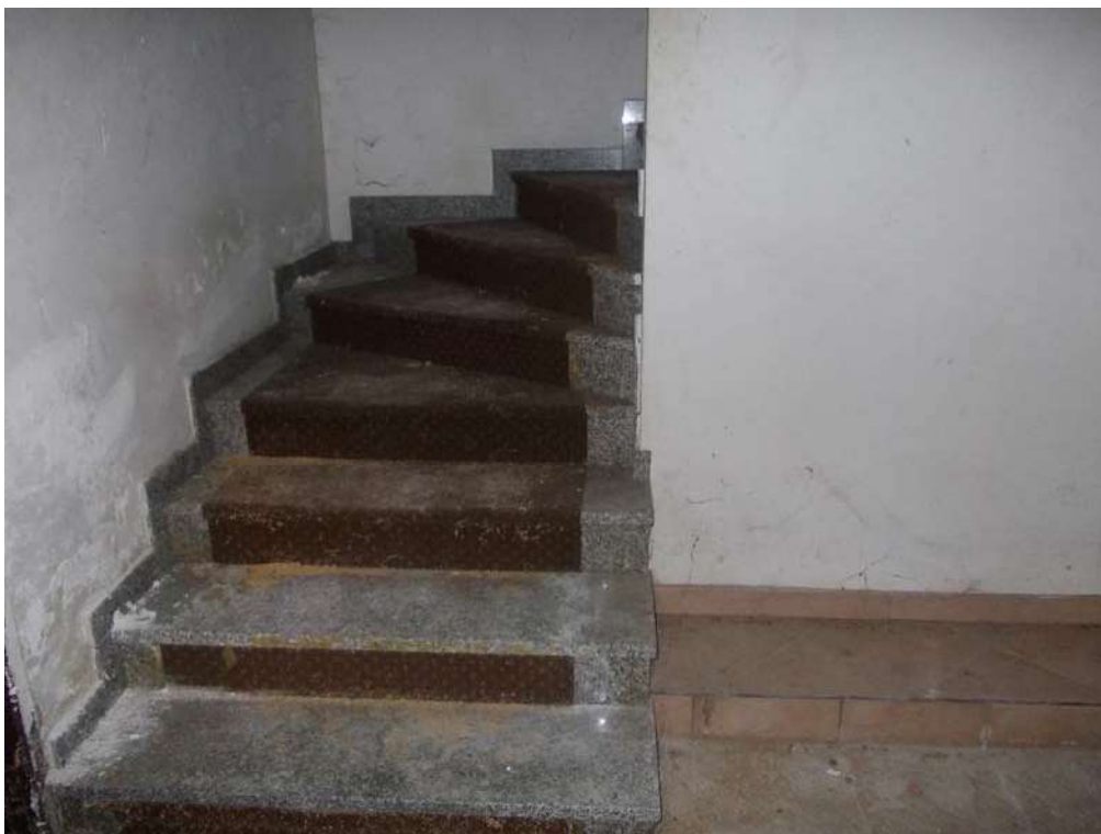
Pianerottolo e accesso dell'unità: vista dall'esterno

Immobile ubicato in Comune di Milano via San Gerolamo Emiliani n. 2 Esecuzione Immobiliare N. 15-2020 – Tribunale di Milano